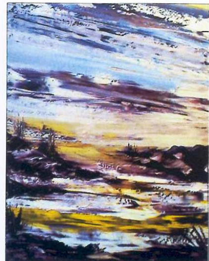
"TERRA DESERTUS ORIENS", 65x81 cm, huile sur toile, 2004.